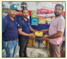
Ravi Honda Service Center, Srikakulam, Andhra Pradesh