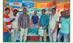
विशाखापत्तनम (आंध्र प्रदेश)