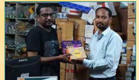
कार्तिक एजेंसिस, विशाखापत्तनम (आंध्र प्रदेश)