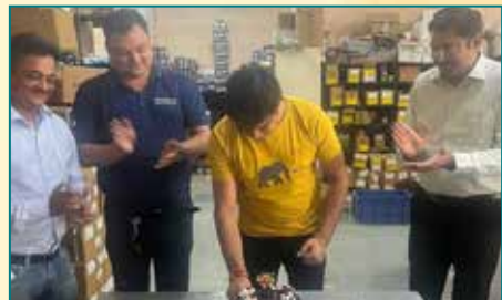
Jai Ambe Spares Pvt. Ltd., Indore (Madhya Pradesh)