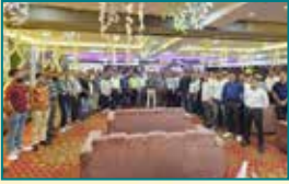
आगरा (उत्तर प्रदेश)