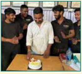
B.N. Motors, Udaipur (Rajasthan)