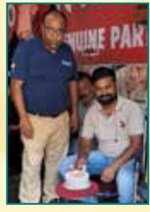
Jagdamba Service Center, Patna (Bihar)