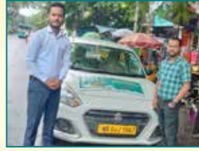
कोलकाता (पश्चिम बंगाल)