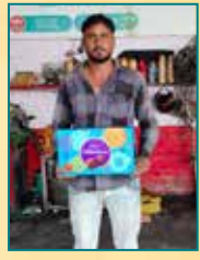
Wheels Care, Lucknow (U.P.)