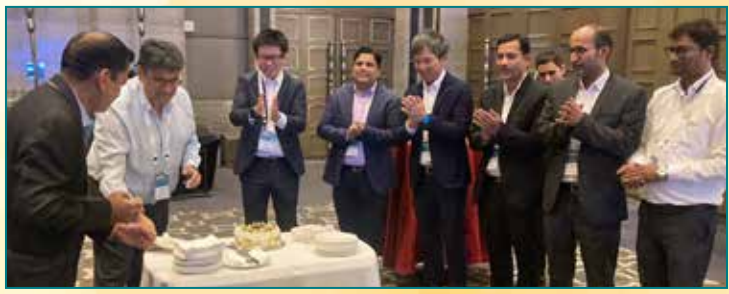
Sunil & Co., Delhi