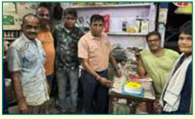
Baba Maruti Workshop, Kota (Rajasthan)