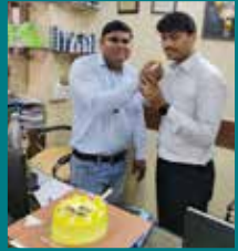
Unique Auto Agency, Pune (Maharashtra)