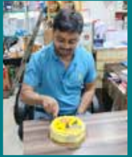
Gupta Trading Corporation, Kolkata (West Bengal)