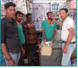
प्रशांत गैराज, हुबली (कर्नाटक)