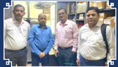
कुणाल सेल्स कॉर्पोरेशन