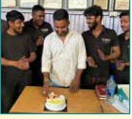
बी.एन. मोटर्स, उदयपुर (राजस्थान)