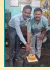
कुमार ऑटो सर्विस, हावड़ा (पश्चिम बंगाल)