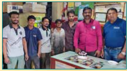
Vilas Honda Service, Nagpur (Maharashtra)