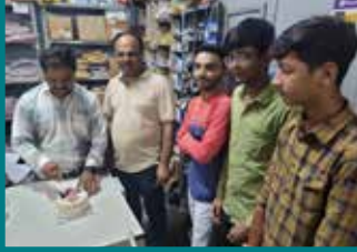
कमलेश ऑटो सेंटर, भावनगर (गुजरात)