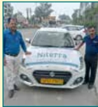
Gorakhpur (Uttar Pradesh)