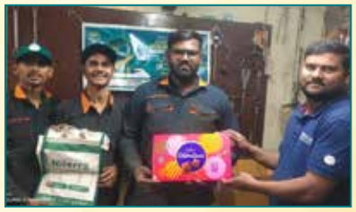
Sambhaji Honda Service, Kolhapur (Maharashtra)