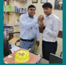
यूनिक ऑटो एजेंसी, पुणे (महाराष्ट्र)