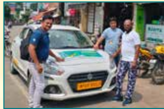
Indore (Madhya Pradesh)