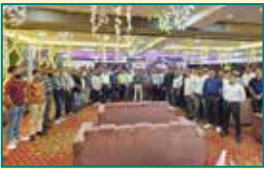
Agra (Uttar Pradesh)