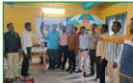
Dewas (Madhya Pradesh)