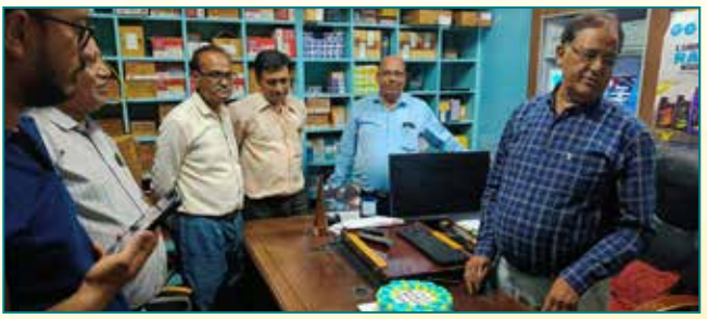
Agarwal Business Center, Jaipur (Rajasthan)