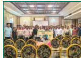
सहारनपुर (उत्तर प्रदेश)