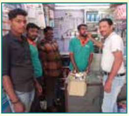
Prashant Garage, Hubli (Karnataka)