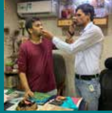
पारेख ट्रेडिंग कंपनी, ठाणे (महाराष्ट्र)