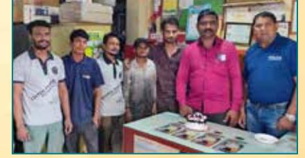
विलास होंडा सर्विस, नागपुर (महाराष्ट्र)