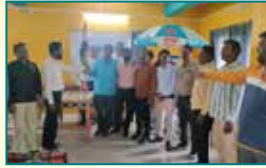
देवास (मध्य प्रदेश)