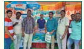
Visakhapatnam (Andhra Pradesh)