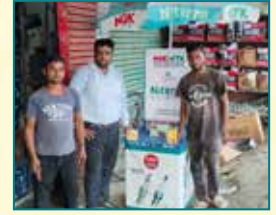
Lucknow (Uttar Pradesh)