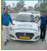
गोरखपुर (उत्तर प्रदेश)