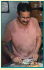
Hayat Automobiles, Delhi