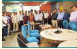
गाजियाबाद (उत्तर प्रदेश)