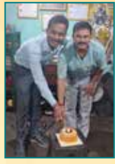
Kumar Auto Service, Howrah (West Bengal)