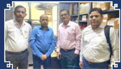
Kunal Sales Corporation