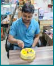
गुप्ता ट्रेडिंग कॉर्पोरेशन, कोलकाता (पश्चिम बंगाल)