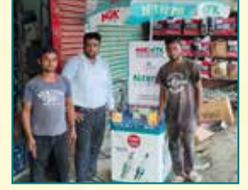
लखनऊ (उत्तर प्रदेश)