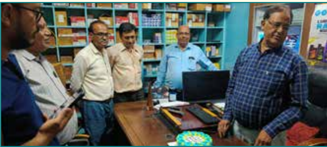
अग्रवाल बिजनेस सेंटर, जयपुर (राजस्थान)