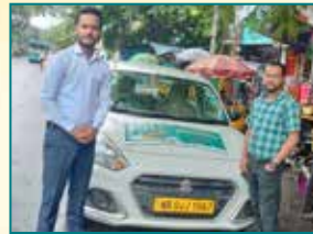
Kolkata (West Bengal)