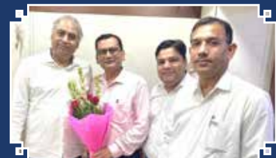
Sagar Scooter House