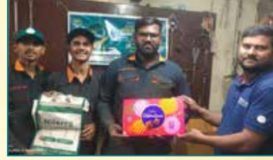
संभाजी होंडा सर्विस, कोल्हापुर (महाराष्ट्र)