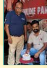
जगदंबा सेवा केंद्र, पटना (बिहार)