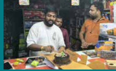
सौरभ बैटरीज एंड मोटर्स, गाजियाबाद (उत्तर प्रदेश)