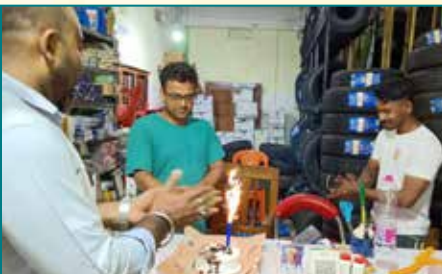
देब ब्रदर्स, अगरतला (त्रिपुरा)