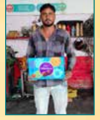
व्हील्स केयर, लखनऊ (उत्तर प्रदेश)