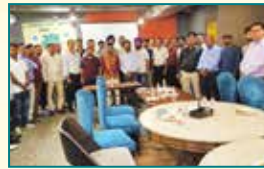
Ghaziabad (Uttar Pradesh)