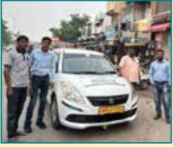
आगरा (उत्तर प्रदेश)