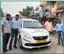
Agra (Uttar Pradesh)