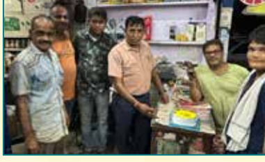
बाबा मारुति वर्कशॉप, कोटा (राजस्थान)