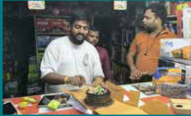
Sourabh Batteries & Motors, Ghaziabad (Uttar Pradesh)