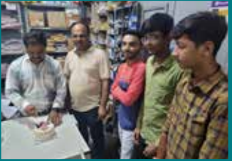
Kamlesh Auto Centre, Bhavnagar (Gujarat)