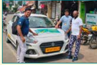
इंदौर (मध्य प्रदेश)