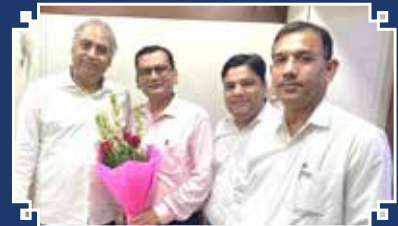
सागर स्कूटर हाउस