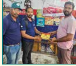
रवि होंडा सर्विस सेंटर, श्रीकाकुलम, आंध्र प्रदेश