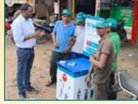
जबलपुर (मध्य प्रदेश)