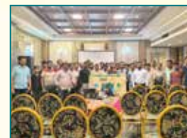
Saharanpur (Uttar Pradesh)