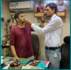
Parekh Trading Company, Thane (Maharashtra)