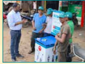
Jabalpur (Madhya Pradesh)