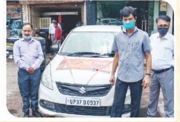
गाजियाबाद, उत्तर प्रदेश में आयोजित वैन कैम्पेन