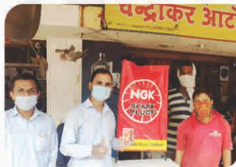
Corner Meet conducted at Raipur, Chhattisgarh