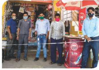
जयपुर, राजस्थान में आयोजित कॉर्नर सम्मेलन