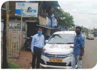
Van Campaign conducted at Kerala