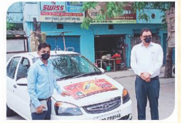
उज्जैन, मध्य प्रदेश में आयोजित वैन कैम्पेन