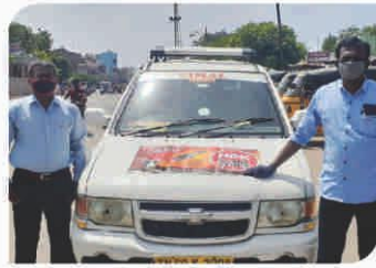
Van Campaign conducted at Madurai, Tamil Nadu