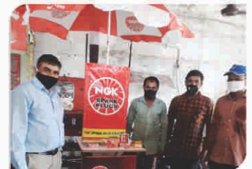
Corner Meet conducted at Surat, Gujarat