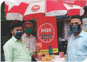
Corner Meet conducted at Patna, Bihar