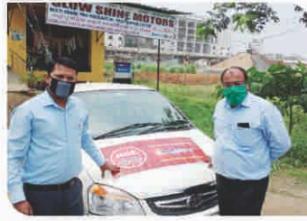
Van Campaign conducted at Patna, Bihar