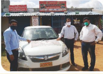
कटक, ओडिशा में आयोजित वैन कैम्पेन