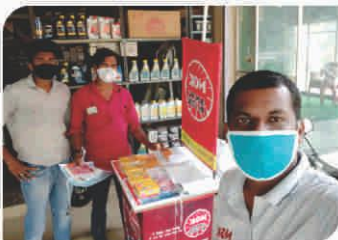
Corner Meet conducted at Kerala