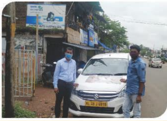
केरला में आयोजित वैन कैम्पेन