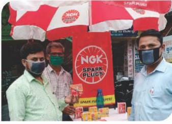
पटना, बिहार में आयोजित कॉर्नर सम्मेलन