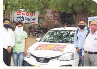
जयपुर, राजस्थान में आयोजित वैन कैम्पेन