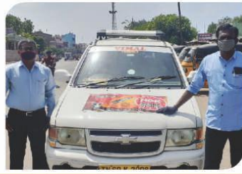
मदुरई, तमिल नाडु में आयोजित वैन कैम्पेन