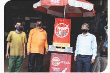
Corner Meet conducted at Kanpur, Uttar Pradesh