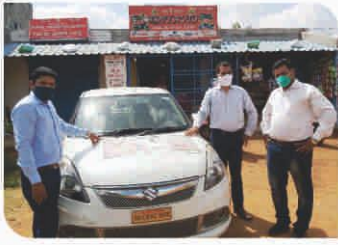
Van Campaign conducted at Cuttack, Odisha