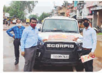
Van Campaign conducted at Raipur, Chhattisgarh