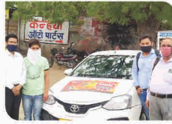
Van Campaign conducted at Jaipur, Rajasthan