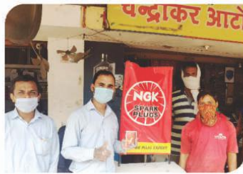
रायपुर, छत्तीसगढ़ में आयोजित कॉर्नर सम्मेलन