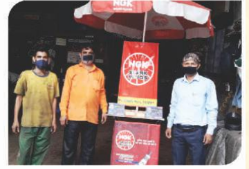
कानपुर, उत्तर प्रदेश में आयोजित कॉर्नर सम्मेलन