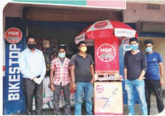
Corner Meet conducted at Ranchi, Jharkhand