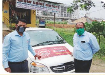
पटना, बिहार में आयोजित वैन कैम्पेन