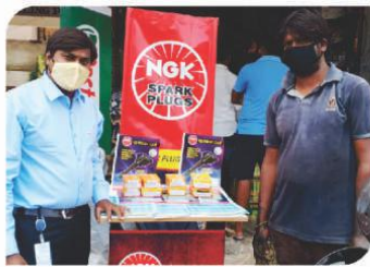
तेलंगाना में आयोजित कॉर्नर सम्मेलन