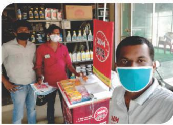
केरला में आयोजित कॉर्नर सम्मेलन