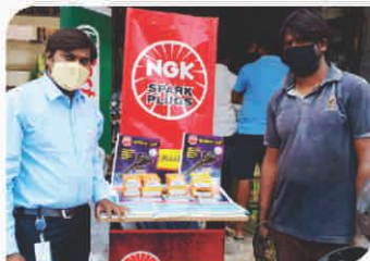
Corner Meet conducted at Telangana