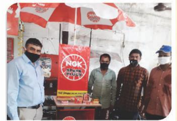
सुरत, गुजरात में आयोजित कॉर्नर सम्मेलन