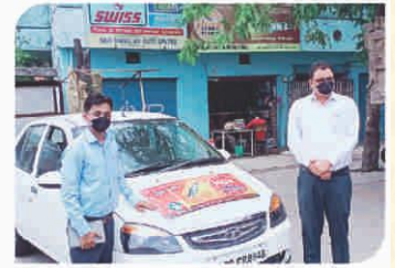
Van Campaign conducted at Ujjain, Madhya Pradesh