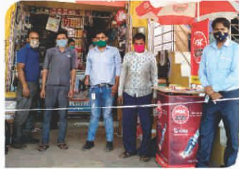
Corner Meet conducted at Jaipur, Rajasthan