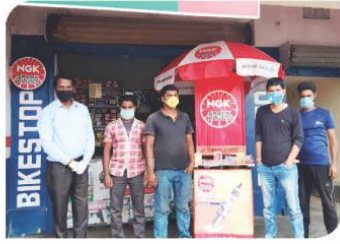
रांची, झारखंड में आयोजित कॉर्नर सम्मेलन