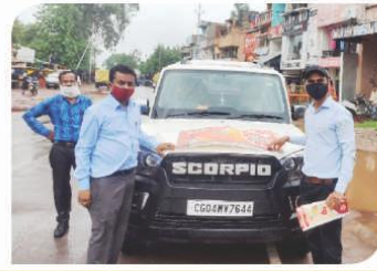
रायपुर, छत्तीसगढ़ में आयोजित वैन कैम्पेन