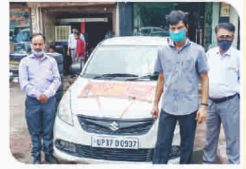
Van Campaign conducted at Ghaziabad, Uttar Pradesh